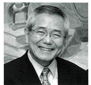
故 根岸 英一 氏 帝人久村奨学生第5回生(1957年)

そして自らの「夢」を見つけたら真理を突き詰めるまで、とことんチャレンジしてください。今後の皆さんの大いなる活躍に期待しています。